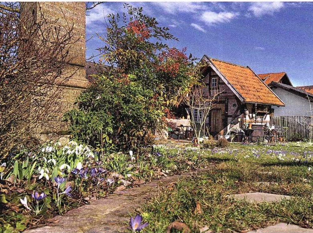
Blickpunkt Vor dem neuen Gartenhäuschen aus alten Baumaterialien steht der Familiengrabstein von Anne Repnows Vorfahren, den sie vor der Verwertung retten konnte.